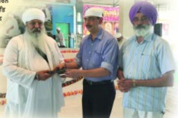
ਪਲ ਮਰਚੈਂਟਸ ਚੰਡੀਗੜ੍ਹ ਵਲੋਂ ਰਤਵਾੜਾ ਸਾਹਿਬ ਹਸਪਤਾਲ ਲਈ ਐਂਬੂਲੈਂਸ ਭੇਟ ਕੀਤੀ ਗਈ